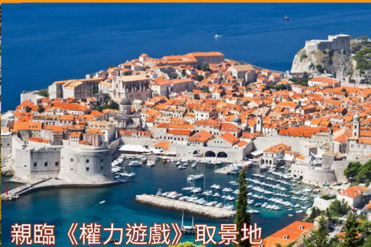
親臨《權力遊戲》取景地