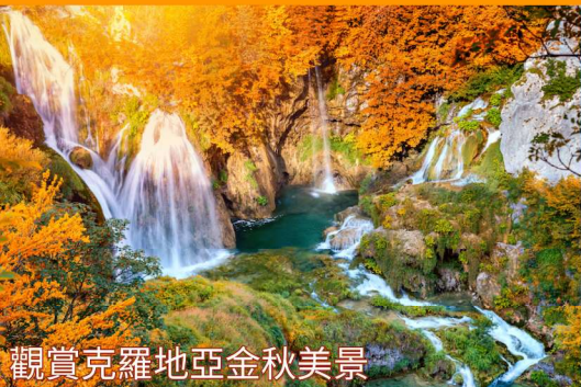
觀賞克羅地亞金秋美景