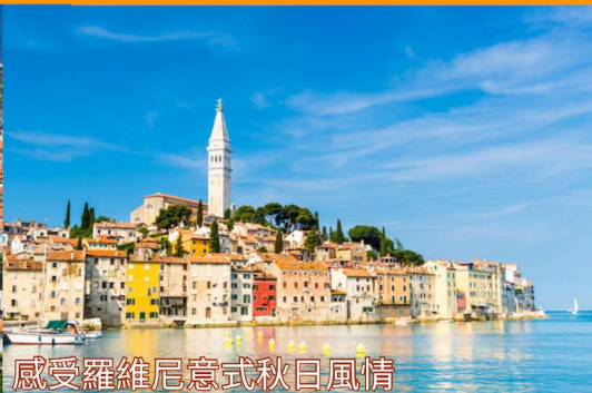
感受羅維尼意式秋日風情

到訪一生必去世界奇景，觀賞濃郁金秋。 探索克羅地亞9大美景，沉浸秋季韻味。 品嚐3大最鮮級食材，細味秋天的味道。 從外到內來一場秋天沐浴之旅，讓心靈好好放鬆。