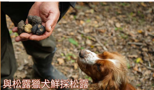
與松露獵犬鮮採松露