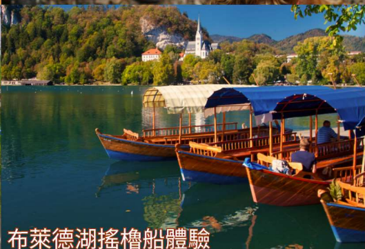
布萊德湖搖櫓船體驗