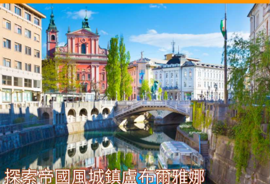
探索帝國風城鎮盧布爾雅娜