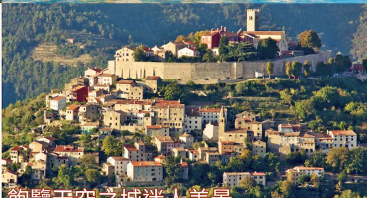
飽覽天空之城迷人美景

到訪一生必去世界奇景，觀賞濃郁金秋。 探索克羅地亞9大美景，沉浸秋季韻味。 品嚐3大最鮮級食材，細味秋天的味道。 從外到內來一場秋天沐浴之旅，讓心靈好好放鬆。