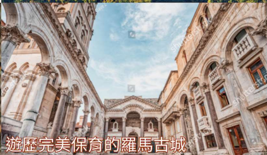
遊歷完美保育的羅馬古城